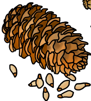
ŠÍŠKY A SEMÍNKA SMRKŮ A BOROVIC